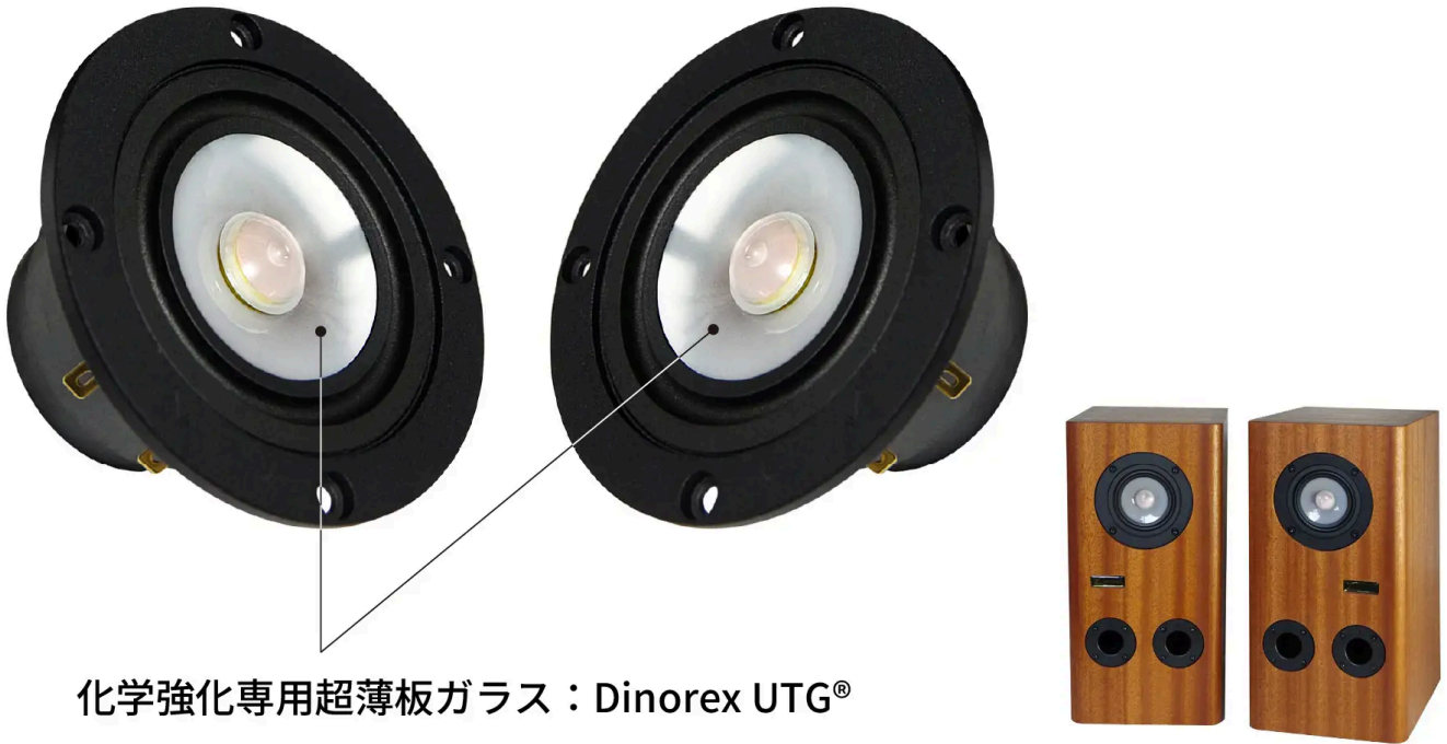
化学強化専用超薄板ガラス：Dinorex UTG®

販売ページ： https://greenfunding.jp/lab/projects/8715