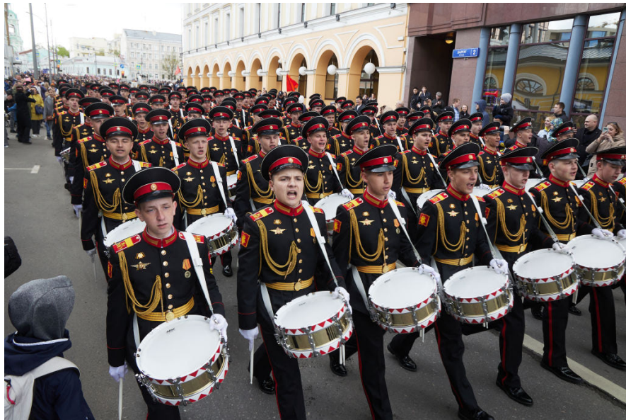
戦勝記念日パレード(2022年5月9日、ロシア・モスクワ)