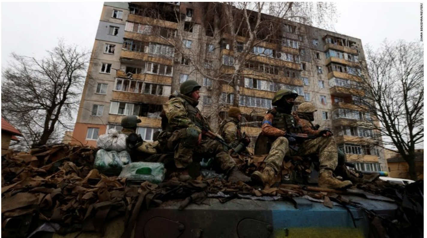
ブチャの街に派遣されたウクライナ兵

米国のブリンケン国務長官はロシアによる戦争犯罪の捜査と、対ロ制裁の強化を呼び掛けた。