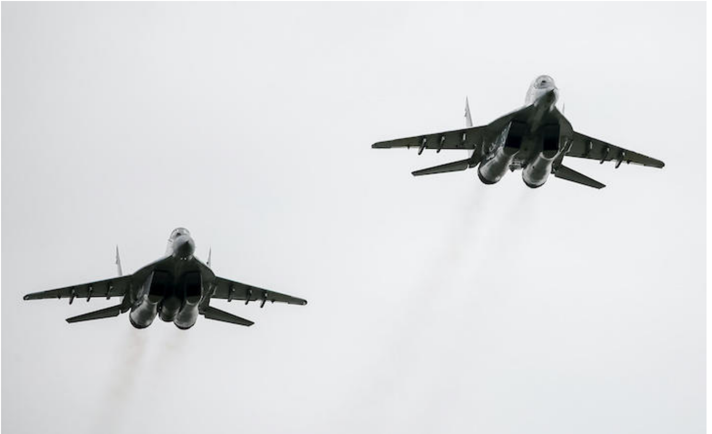
ウクライナ空軍のミグ29は旧ソ連製

<ウクライナが求めてきた空域封鎖は、ロシアとNATOの直接衝突につながりかねないと大国は断り続けてきたが、旧ソ連や旧東欧諸国などロシアに近い国々は恐怖におのいている>